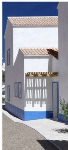
Living Comporta | Rua do Secador, n.º 5, 7580-648 Comporta | Arq. João Resende Arq. Sara Afonso | http://www.livingcomporta.com/