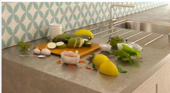
Living Comporta | Rua do Secador, n.º 5, 7580-648 Comporta | Arq. João Resende Arq. Sara Afonso | http://www.livingcomporta.com/

Cuisines - Équipées, armoires avec portes en bois et revêtement de mosaïque au-dessus du plan de travail et de plancher ou de comptoir selon les cas.