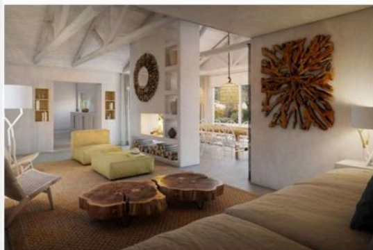
Living Comporta | Rua do Secador, n.º 5, 7580-648 Comporta | Arq. João Resende Arq. Sara Afonso | http://www.livingcomporta.com/

Plafonds - En plâtre peint, enduit peint, poutres apparentes en bois, installées sur une structure de support fixe avec des planches de bois superposées.