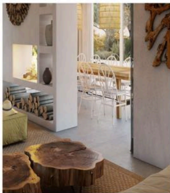
Living Comporta | Rua do Secador, n.º 5, 7580-648 Comporta | Arq. João Resende Arq. Sara Afonso | http://www.livingcomporta.com/

Plancher intérieur en micro-ciment ou plancher de béton lissé.