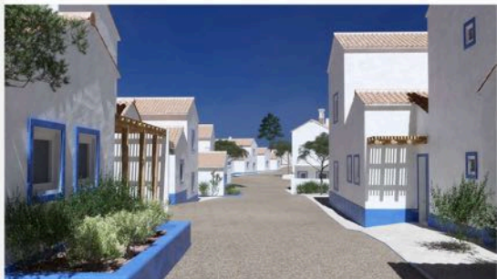
Living Comporta | Rua do Secador, n.º 5, 7580-648 Comporta | Arq. João Resende Arq. Sara Afonso | http://www.livingcomporta.com/

Structure en béton armé, antisismique. Cadres en aluminium laqué avec double vitrage. Doubls murs extérieurs avec isolation thermique. Toiture - toit à pignon. Portes et fenêtres avec moustiquaire.