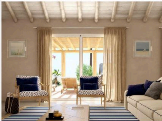
Living Comporta | Rua do Secador, n.º 3, 7580-648 Comporta | Arq. João Resende Arq. Sara Afonso | http://www.livingcomporta.com/

Plafonds - En plâtre peint, enduit peint, poutres apparentes en bois, installées sur une structure de support fixe avec des planches de bois superposées.