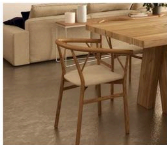
Living Comporta | Rua do Secador, n.º 7580-648 Comporta | Arq. João Resende Arq. Sara Afonso | http://www.livingcomporta.com/

Plancher intérieur en micro-ciment ou plancher de béton lissé.