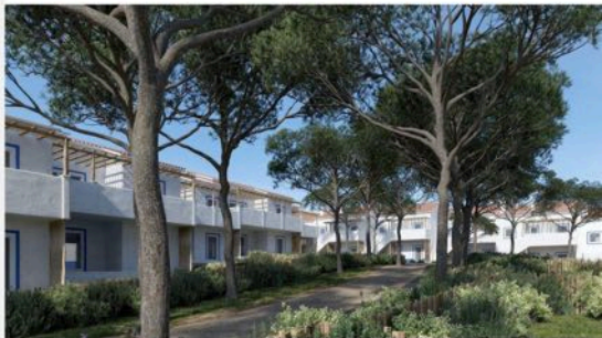
Living Comporta | Rua do Secador, n.º 3, 7580-648 Comporta | Arq. João Resende Arq. Sara Afonso | http://www.livingcomporta.com/

Structure en béton armé, antisismique. Cadres en aluminium laqué avec double vitrage. Doubls murs extérieures avec isolation thermique. Toiture – toit à pignon. Fenêtres - cadre en aluminium blanc avec double vitrage. Portes et fenêtres avec moustiquaire.