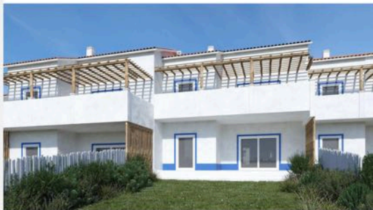
Living Comporta | Rua do Secador, n.º 7580-648 Comporta | Arq. João Resende Arq. Sara Afonso | http://www.livingcomporta.com/

Terrasses et balcons avec pavement en micro-ciment ou béton lissé. Murs en plâtre peint et moulures autour les fenêtres et les portes.