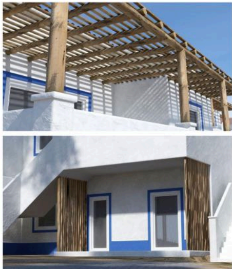
Living Comporta | Rua do Secador, n.º 3, 7580-648 Comporta | Arq. João Resende Arq. Sara Afonso | http://www.livingcomporta.com/

Ombrage de pergolas et palissade en bois, entre les habitations.