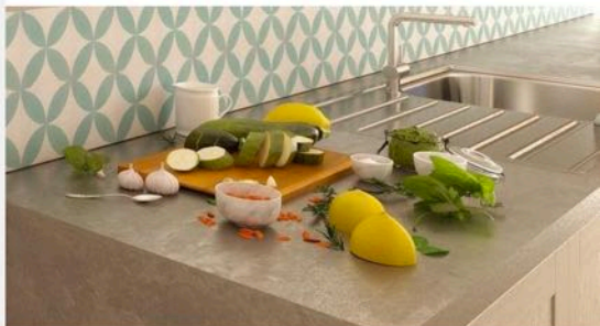
Living Comporta | Rua do Secador, n.º 3, 7580-648 Comporta | Arq. João Resende Arq. Sara Afonso | http://www.livingcomporta.com/

Cuisines - Équipées, intégrées dans des armoires avec portes en bois et revêtement de mosaïque au-dessus du plan de travail.